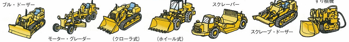
ブル・ドーザー モーター・グレーダー (クローラ式) (ホイール式) スクレーパー スクレーブ・ドーザー ずり積機