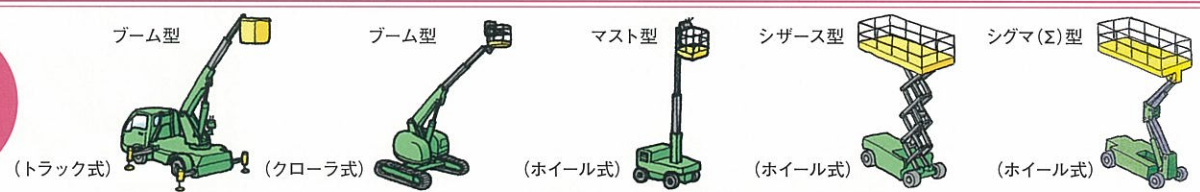
ブーム型 (トラック式) (クローラ式) (ホイール式) マスト型 (ホイール式) シザース型 (ホイール式) シグマ(Σ)型 (ホイール式)

特定自主検査や月例検査でお知りになりたいことはございませんか。 当協会支部や協会会員にお気軽にご相談下さい。