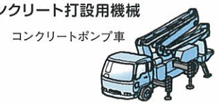
コンクリートポンプ車