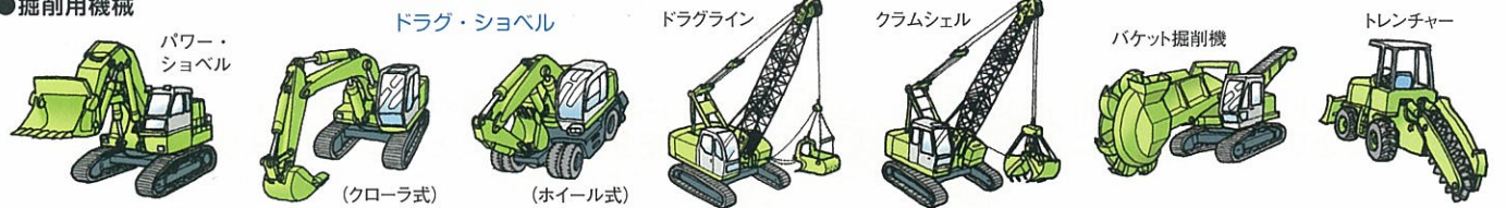
パワー・ショベル (クローラ式) (ホイール式) ドラグ・ショベル ドラグライン クラムシェル バケット掘削機 トレンチャー