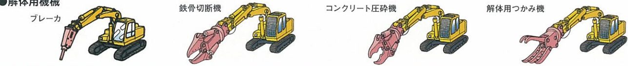
ブレーカ 鉄骨切断機 コンクリート圧砕機 解体用つかみ機