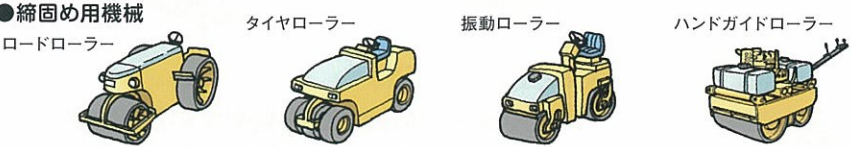
ロードローラー タイヤローラー 振動ローラー ハンドガイドローラー