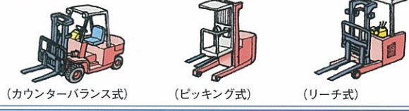
(カウンターバランス式) (ピッキング式) (リーチ式)